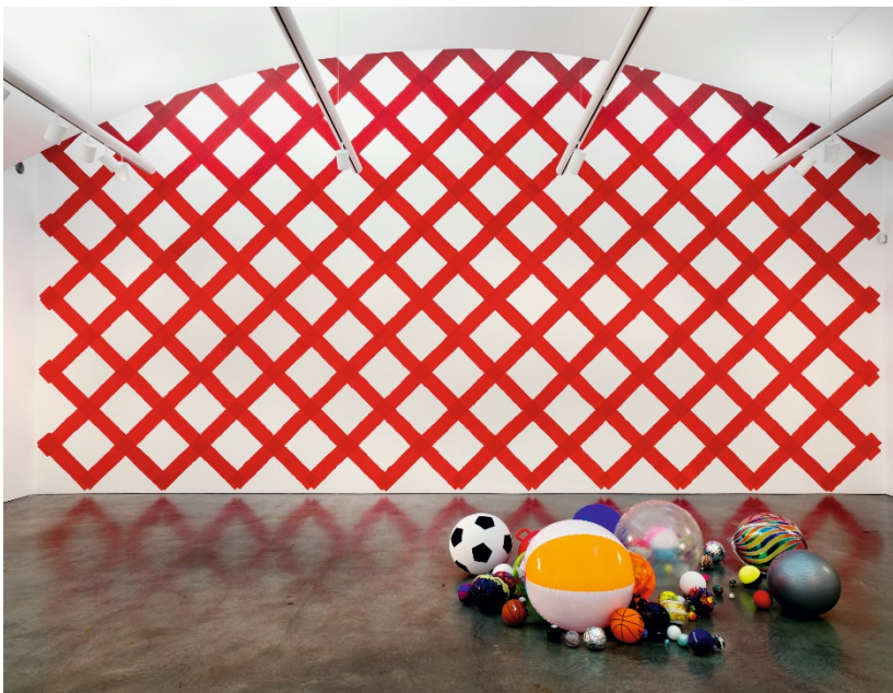
Photo: Hugo Glendinning © Martin Creed. All Rights Reserved, VG Bild-Kunst, Bonn 2023