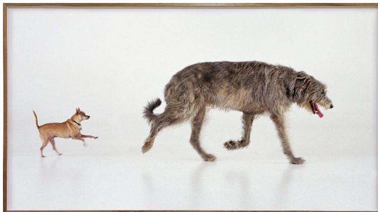
Martin Creed Work No. 1094 (2011)

Yellow balloons Multiple parts, each balloon 16 in / 40.6 cm diameter, overall dimensions variable Installation at Micromuseum, Pa- lermo, Italy, 2001 (Detail) © Martin Creed. All Rights Reserved, VG Bild-Kunst, Bonn 2023