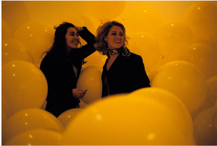
Martin Creed Work No. 265 (2001)

Yellow balloons Multiple parts, each balloon 16 in / 40.6 cm diameter, overall dimensions variable Installation at Micromuseum, Pa- lermo, Italy, 2001 (Detail) © Martin Creed. All Rights Reserved, VG Bild-Kunst, Bonn 2023