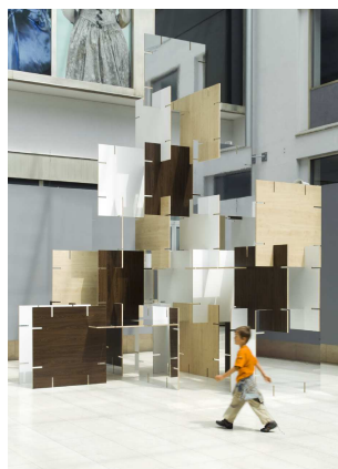
Gerold Tagwerker „construct_unfinished/XL“, 2009 Ausstellungsansicht „FIFTY FIFTY - Kunst im Dialog mit den 50er Jahren“, WIEN MUSEUM, Wien 2009