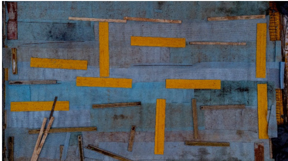
Johannes Hauser Ohne Titel, 2022 © Johannes Hauser

Bitte beachten Sie, dass laut § 50 UrhG eine genehmigungs- und vergütungsfreie Nutzung nur im Rahmen der aktuellen Berichterstattung über die Ausstellung zulässig ist.