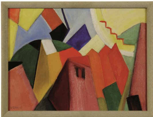
Walter Dexel Landschaft mit Häusern , 1918 © Nachlass Walter Dexel