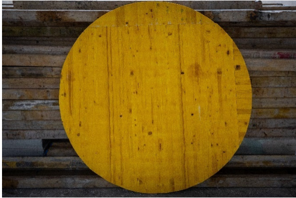
Johannes Hauser Ohne Titel, 2022 © Johannes Hauser