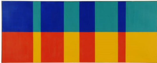
Max Bill Vierfarbige Struktur , 1970 VG Bild-Kunst, Bonn 2023

Hochauflösende Abbildungen finden Sie in unserem Pressebereich unter presse.mkk-ingolstadt.de/pressebereich/