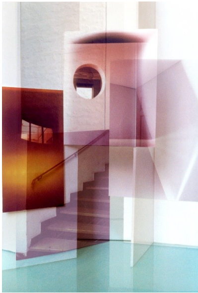
Susa Templin Spatial Abstraction #3, 2020 Mehrschichtige Collage, Plexiglas, UV Pigmentdruck Galerie Anita Beckers © VG Bild-Kunst, Bonn 2021