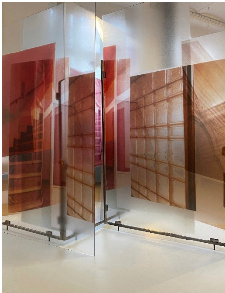
Susa Templin Westberlin, 2020 Skulptur, Plexiglas, UV Pigmentdruck, geschlossener Stahl Haus am Lützowplatz © VG Bild-Kunst, Bonn 2021