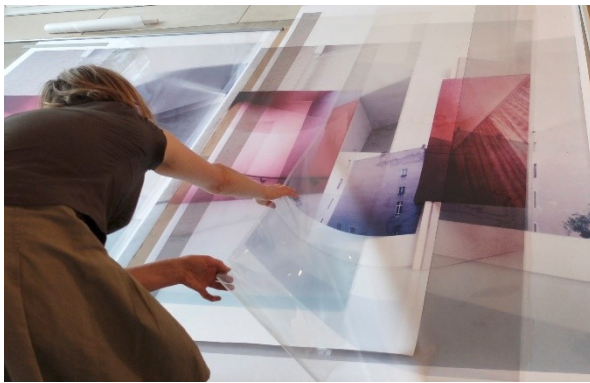
Susa Templin Sites & Constructions, 2020 Installationsansicht © VG Bild-Kunst, Bonn 2021